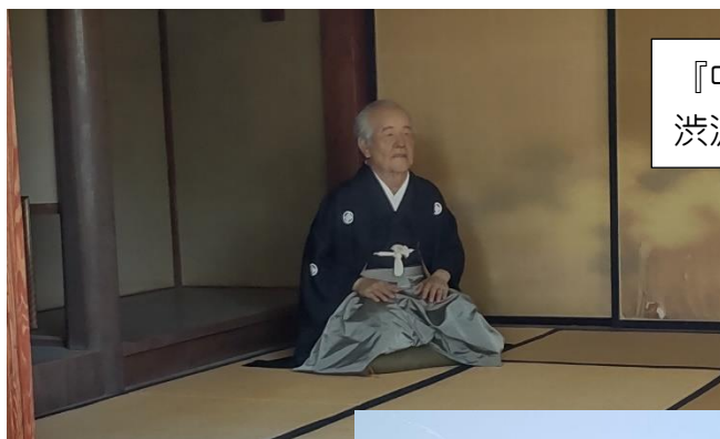
『中の家』に展示してある 渋沢翁のアンドロイド